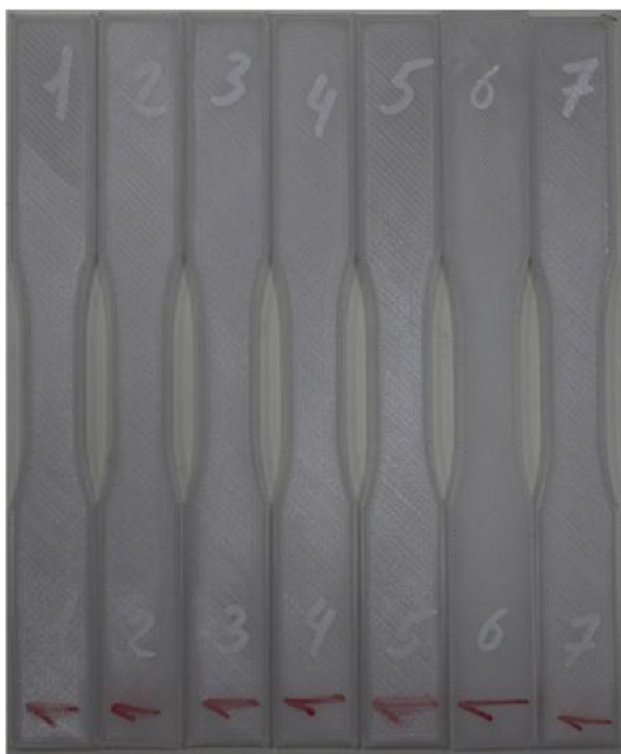
Фотографии элементарных образцов REC Relax до испытаний